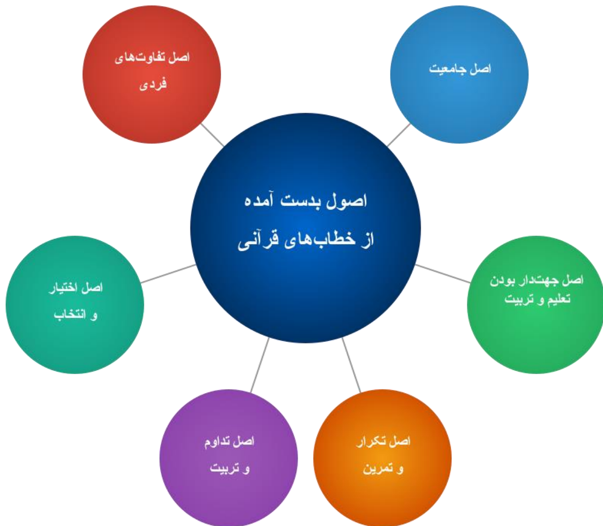
شکل ۱. اصول بدست آمده از خطاب‌های قرآنی