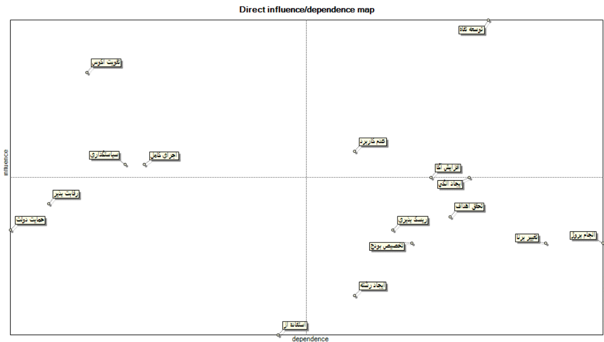
شکل ۱. نقشه تأثیرگذاری و تأثیرپذیری پیشرانها

تحلیل آماری نشان داد که پیشرانها بر اساس میزان اهمیت و عدم قطعیت قابل اولویت‌بندی هستند. به طوری که دو پیشران «کاربردی بودن دانش دانشگاهی در صنعت خودرو» و «تقویت اکوسیستم نوآوری در صنعت خودرو» بالاترین اولویت‌ها را کسب کردند. برای شناسایی دقیق‌تر پیشرانها، از نرم‌افزار MICMAC استفاده شد. این نرم‌افزار، پیشرانهای مؤثر بر توسعه ارتباط دانشگاه با صنعت خودرو را در قالب یک ماتریس 16 \times 16 تحلیل کرد. نتایج نشان داد که این دو پیشران در هر دو روش (آزمون فریدمن و تحلیل MICMAC) به عنوان مهم‌ترین عوامل شناسایی شدند.