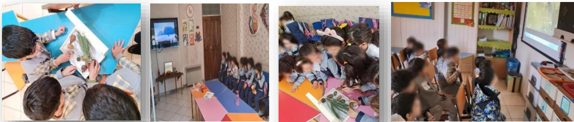
شکل ۲. دیدن مستند از زندگی پنگوئن و اشنایی با کاج و برگ‌های درخت کاج

دیدن مستند از زندگی پنگوئن و اشنایی با کاج و برگ‌های درخت کاج