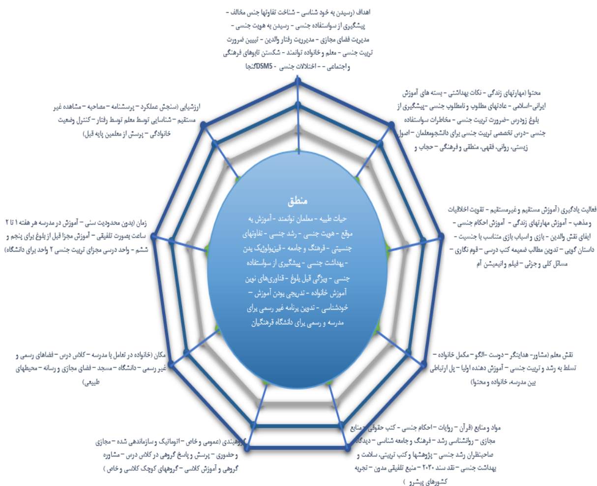
شکل ۲. الگوی برنامه درسی تربیت جنسی دانشگاه فرهنگیان

تأکید دارد. روش‌های یاددهی-یادگیری نیز شامل آموزش مستقیم و غیرمستقیم، تقویت اخلاق و مذهب، مهارت‌آموزی، استفاده از نقش والدین، ابزارهای هنری، داستان، بازی و رسانه است. نقش معلم به‌عنوان راهنما، مشاور و مکمل خانواده برجسته شده و منابع مورد استفاده شامل قرآن، روایات، روان‌شناسی رشد، جامعه‌شناسی، پژوهش‌های تربیتی و تجربیات کشورهای پیشرو است. همچنین، گروه‌بندی‌های متنوع، فضاهای رسمی و غیررسمی، آموزش‌های مدرسه‌ای و دانشگاهی و شیوه‌های ترکیبی ارزشیابی در این برنامه مورد توجه قرار گرفته‌اند. برآیند نتایج نشان می‌دهد که طراحی برنامه درسی تربیت جنسی در دانشگاه فرهنگیان نیازمند رویکردی جامع، تدریجی، فرهنگی و مبتنی بر نیازهای واقعی دانشجو معلمان است تا بتواند به تربیت معلمان توانمند و آگاه در حوزه سلامت جنسی منجر شود.